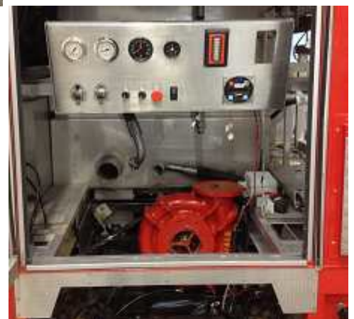
Einbau der Überholten der HALE RMG Pumpe und ESP Entlüftungspumpe